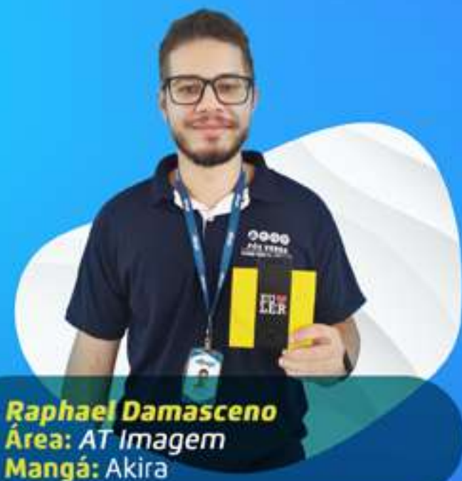
Raphael Damasceno Área: AT Imagem Mangá: Akira